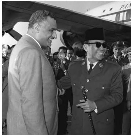
الرئيس جمال عبد الناصر يستقبل الرئيس الأندونيسى سوكارنو بمطار المناظرة ١٢/١/١٩٥٨